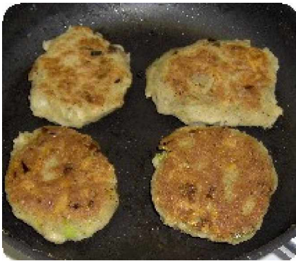
HIPM130 emf mit Käse

250 g Kichererbsen roh, ca 500 g eingeweicht