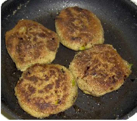
ohne Käse, Vegan